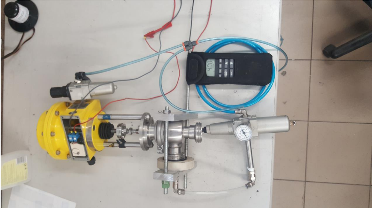
Zawór KS2438, nr. seryjny: 120507